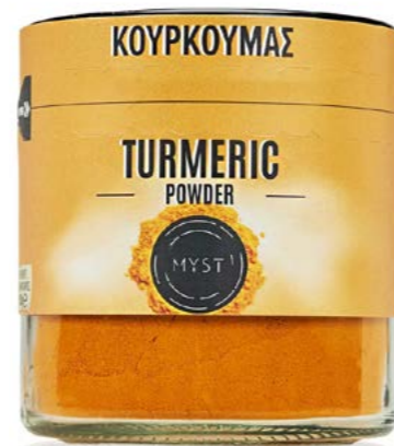
TURMERIC POWDER ΚΟΥΡΚΟΥΜΑΣ ΣΚΟΝΗ ΒΑΡΟΣ / CAPACITY JAR : NET 100g ΔΙΑΡΚΕΙΑ / LIFE 3 ΧΡΟΝΙΑ / 3 YEARS CODE 1318