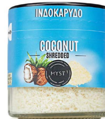
COCONUT SHREDED ΙΝΔΟΚΑΡΥΔΟ ΤΡΙΜΜΕΝΟ ΒΑΡΟΣ / CAPACITY JAR : NET 70g ΔΙΑΡΚΕΙΑ / LIFE 3 ΧΡΟΝΙΑ / 3 YEARS CODE 1324