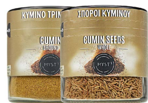
CUMIN WHOLE & GROUND ΚΥΜΙΝΟ ΟΛΟΚΛΗΡΟ & ΤΡΙΜΜΕΝΟ ΒΑΡΟΣ / CAPACITY GROUND : NET 100g WHOLE : NET 90g ΔΙΑΡΚΕΙΑ / LIFE 3 ΧΡΟΝΙΑ / 3 YEARS CODE 1325 1326