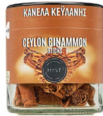
CEYLON CINAMMON STICKS ΚΑΝΕΛΑ ΚΕΥΛΑΝΗΣ ΞΥΛΟ ΒΑΡΟΣ / CAPACITY JAR : NET 40g ΔΙΑΡΚΕΙΑ / LIFE 3 ΧΡΟΝΙΑ / 3 YEARS CODE 1319