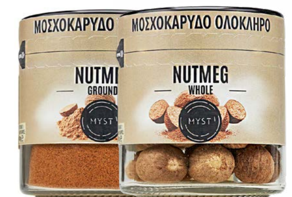
NUTMEG WHOLE & GROUND ΜΟΣΧΟΚΑΡΥΔΟ ΟΛΟΚΛΗΡΟ & ΤΡΙΜΜΕΝΟ ΒΑΡΟΣ / CAPACITY GROUND : NET 100g WHOLE : NET 100g ΔΙΑΡΚΕΙΑ / LIFE 3 ΧΡΟΝΙΑ / 3 YEARS CODE 1329 1330