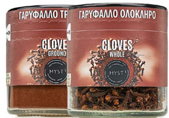
CLOVES WHOLE & GROUND ΓΑΡΥΦΑΛΛΟ ΟΛΟΚΛΗΡΟ & ΣΚΟΝΗ ΒΑΡΟΣ / CAPACITY WHOLE : NET 70g GROUND : NET 90g ΔΙΑΡΚΕΙΑ / LIFE 3 ΧΡΟΝΙΑ / 3 YEARS CODE 1321 1322