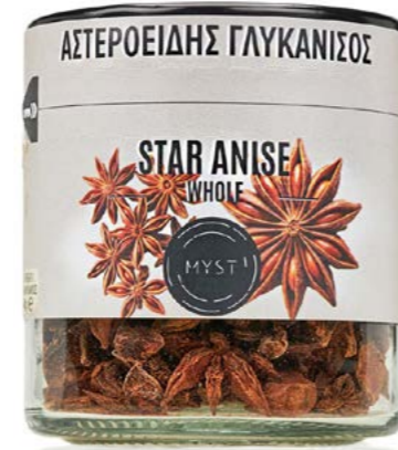
STAR ANISE ΑΣΤΕΡΟΕΙΔΗΣ ΓΛΥΚΑΝΙΣΟΣ ΒΑΡΟΣ / CAPACITY JAR : NET 40g ΔΙΑΡΚΕΙΑ / LIFE 3 ΧΡΟΝΙΑ / 3 YEARS CODE 1323