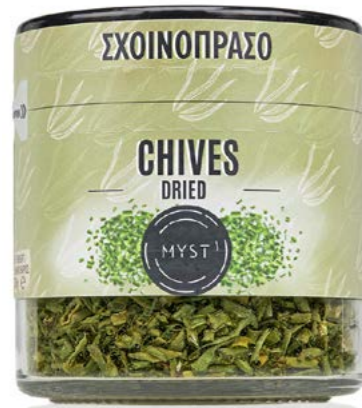
CHIVES DRY ΣΧΟΙΝΟΠΡΑΣΟ ΑΠΟΞΗΡΑΜΕΝΟ ΒΑΡΟΣ / CAPACITY JAR : NET 25g ΔΙΑΡΚΕΙΑ / LIFE 3 ΧΡΟΝΙΑ / 3 YEARS CODE 1317