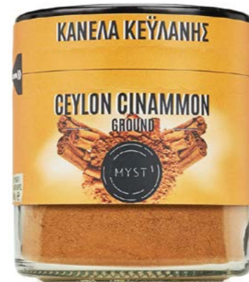
CEYLON CINAMMON GROUND ΚΑΝΕΛΑ ΚΕΥΛΑΝΗΣ ΣΚΟΝΗ ΒΑΡΟΣ / CAPACITY JAR : NET 90g ΔΙΑΡΚΕΙΑ / LIFE 3 ΧΡΟΝΙΑ / 3 YEARS CODE 1320