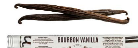
BOURBON VANILLA (2 STICKS) ΦΥΣΙΚΗ ΒΑΝΙΛΙΑ (2 ΤΕΜΑΧΙΑ) ΒΑΡΟΣ / CAPACITY JAR : NET 2g ΔΙΑΡΚΕΙΑ / LIFE 2 ΧΡΟΝΙΑ / 2 YEARS CODE 1331