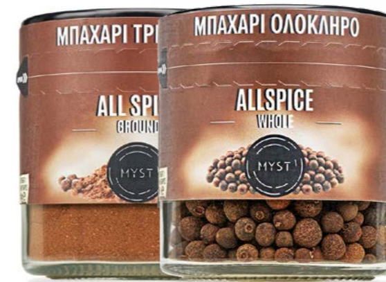
ALLSPICE WHOLE & GROUND ΜΠΑΧΑΡΙ ΟΛΟΚΛΗΡΟ & ΤΡΙΜΜΕΝΟ ΒΑΡΟΣ / CAPACITY GROUND : NET 100g WHOLE : NET 75g ΔΙΑΡΚΕΙΑ / LIFE 3 ΧΡΟΝΙΑ / 3 YEARS CODE 1327 1328